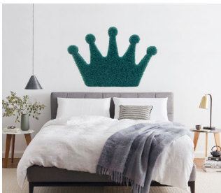
Bett mit EvoPoreVHRC Krone